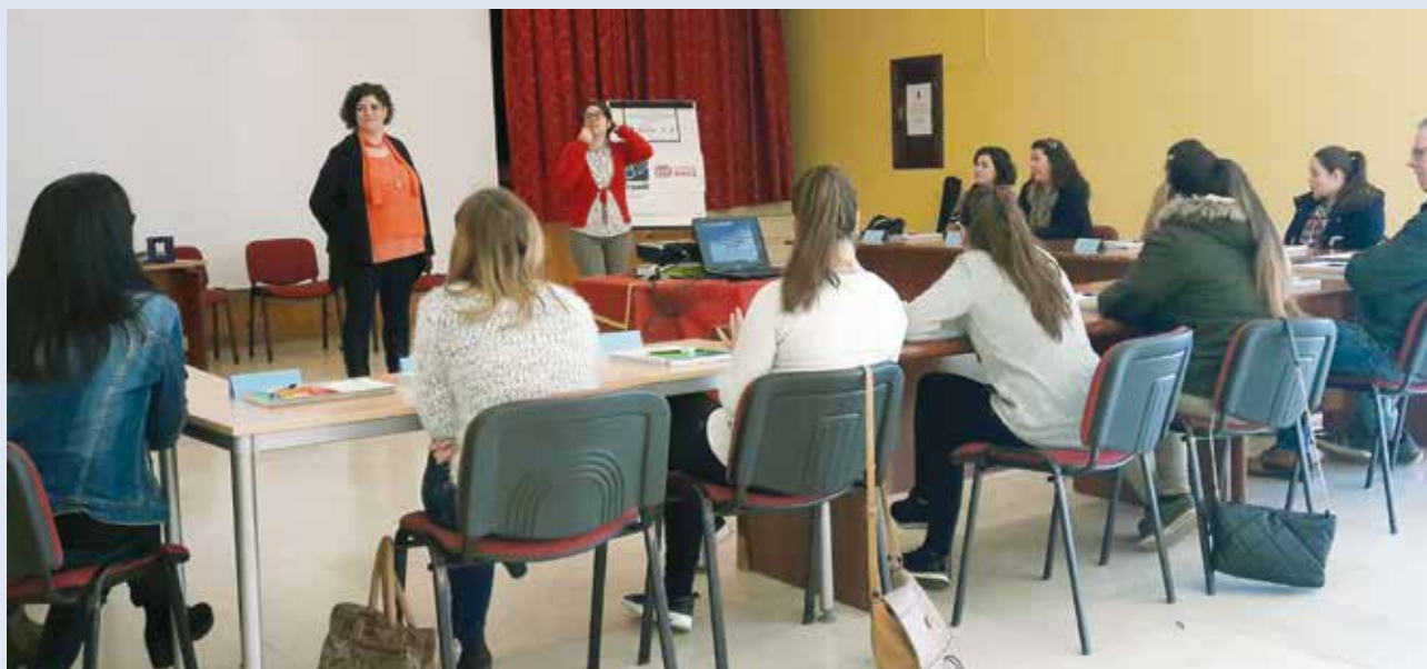
La formación continua es una baza fundamental para la profesionalización del personal de FEGADI