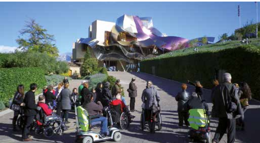
La Bodega Marqués de Riscal dispone de rampas y ascensores en todas las zonas visitables.

La Bodega Marqués de Riscal, ha hecho un gran esfuerzo para recibir visitas de personas con movilidad reducida