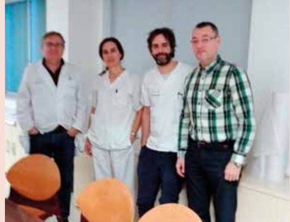
Profesionales del proyecto de ACCU Ourense

limpieza, la presentación, de ser el caso, del parte de baja laboral en la empresa en que trabaja y las gestiones administrativas de recepción, registro o entrega de documentación de carácter urgente en aquellos casos en que éstos se encuentren solos o vean imposibilitada la salida de su domicilio en periodo de brote.