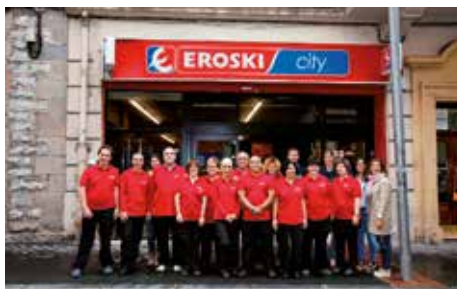
Equipo del Supermercado Eroski Gureak de Vitoria.