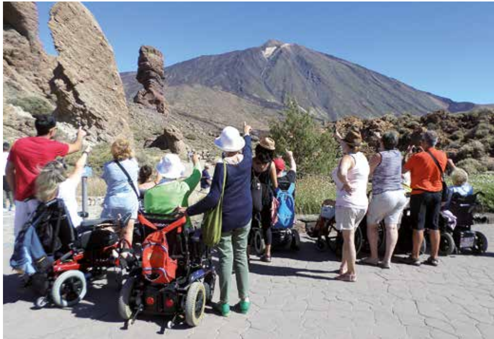
Excursión accesible a las Cañadas del Teide.

La existencia de barreras en el turismo es innegable y las administraciones y agentes de este sector deben ponerse manos a la obra para cumplir con el plazo legal del 4 de diciembre de 2017 para que todo sea accesible, pero existen joyas turísticas para todas las personas donde poder disfrutar de unas vacaciones accesibles.