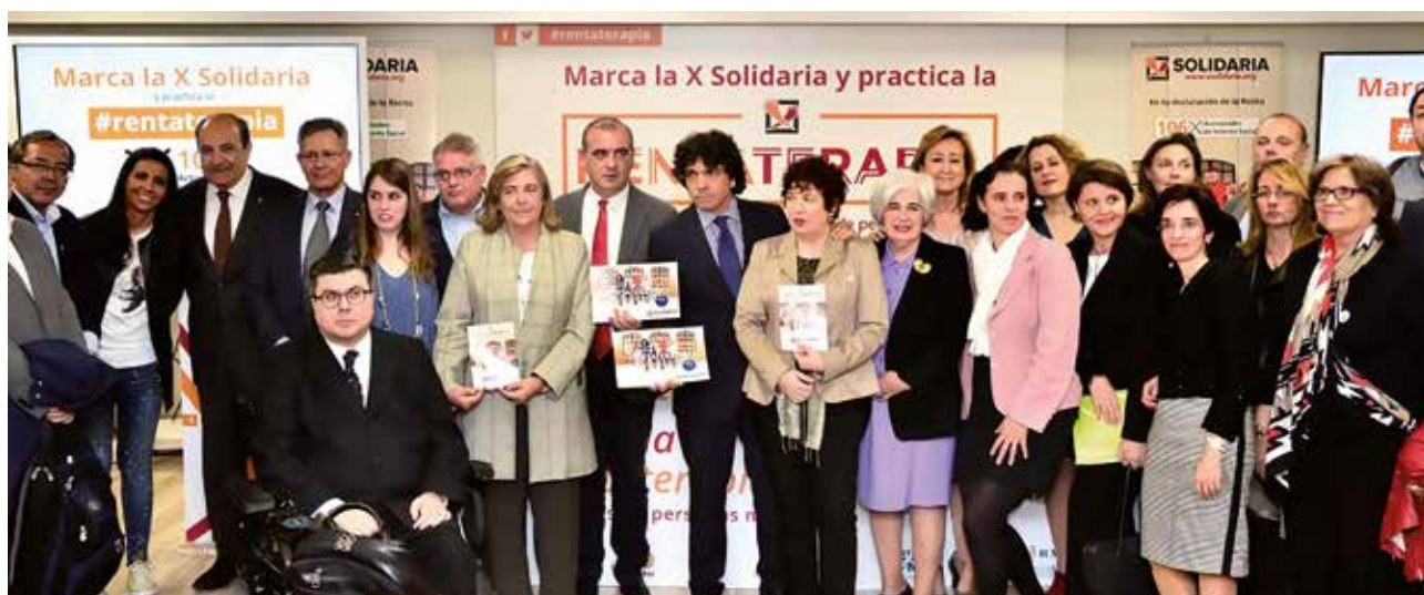
Participantes en la rueda de prensa de la Campaña y miembros de las organizaciones que la coordinan