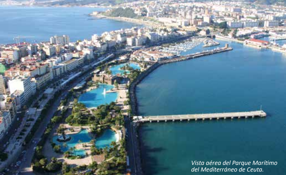
Vista aérea del Parque Marítimo del Mediterráneo de Ceuta.