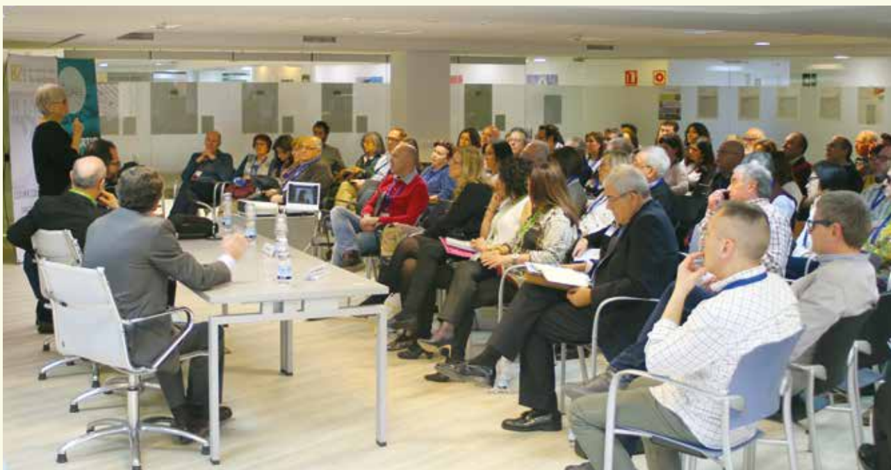
Intervención en el X Congreso Nacional de Miastenia Gravis y Congénita