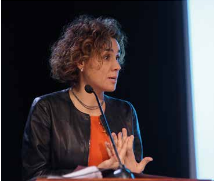
Dolors Montserrat durante su intervención en el acto de Niños con Cáncer

L a Ministra de Sanidad, Servicios Sociales e Igualdad, Dolors Montserrat, se comprometió durante el acto de conmemoración del Día Internacional del Niño con Cáncer 2017, celebrado por la Federación Española de Padres de NIÑOS CON CÁNCER, a "impulsar junto a las Comunidades Autónomas la implantación de los cuidados paliativos a domicilio" y mejorar así la atención que reciben los niños con cáncer independientemente del lugar en el que vivan, escuchando así la petición de la entidad.