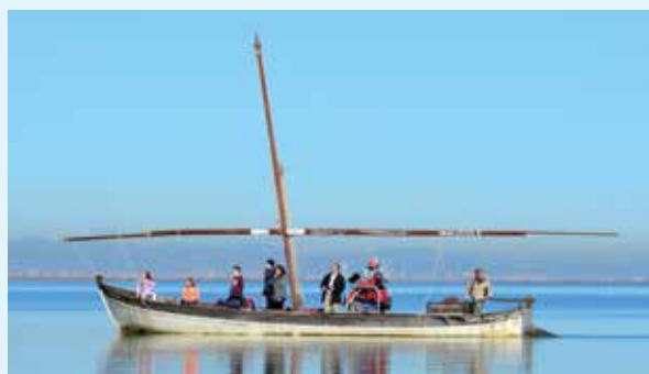
Barca adaptada en el parque natural de La Albufera

Este proyecto ha posibilitado la ejecución de una serie de mejoras de accesibilidad en los museos o parajes reseñados, entre las que destaca la adaptación de una barca en la Albufera y su embarcadero, que posibilitará por primera