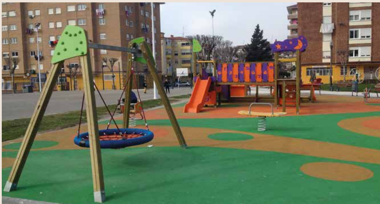
En el documento se pide que se incluyan juegos y columpios adaptados para niños con discapacidad en los parques infantiles