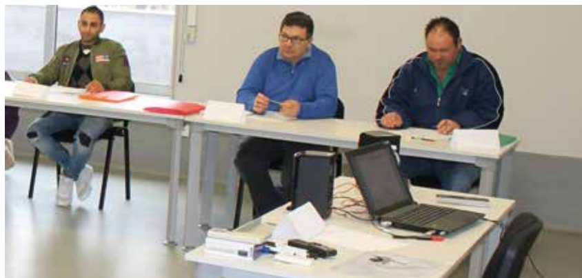
Quince personas se han formado durante dos meses en el curso de COGAMI

De estas personas inscritas en la base de datos, el 56% tienen entre 45 y 65 años, por eso desde COGAMI se considera necesario el reciclaje profesional, para poder adaptarse a las nuevas exigencias del mercado laboral.