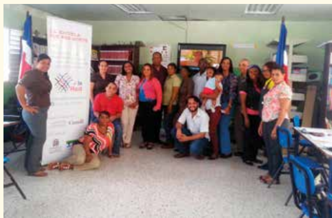
En el proyecto se han implicado alumnos, profesores y padres

El proyecto se ha desarrollado con la financiación del Fondo Canadiense de Iniciativas Locales y la colaboración del Ministerio de Educación de República Dominicana, el Centro de Recursos para la Atención a la Diversidad de la Regional 10,