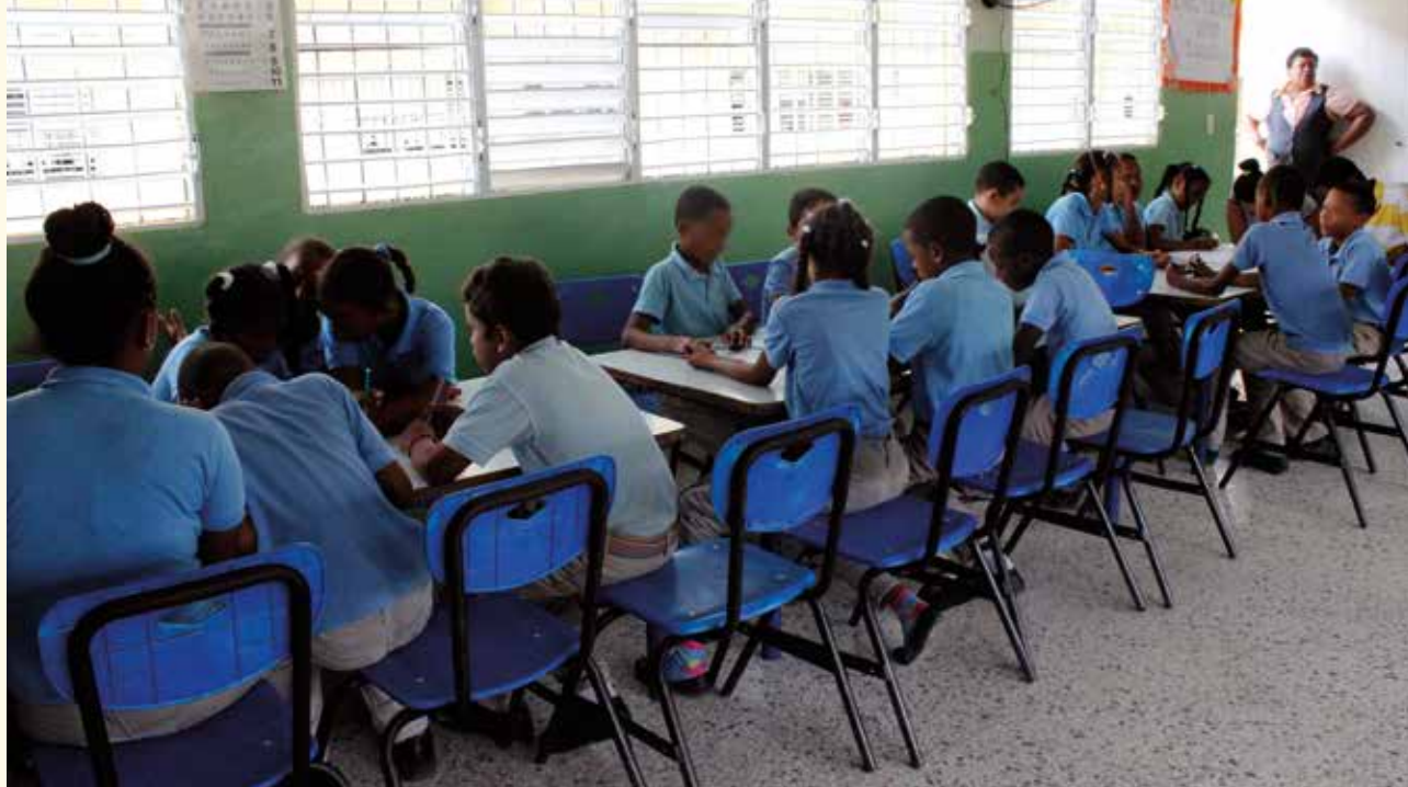
Alumnado de la escuela Minerva Mirabal participante en el proyecto