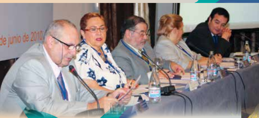
En la Asamblea estuvieron representadas más de 1600 asociaciones

En esta Asamblea se produjo la incorporación de la Confederación de Mujeres con Discapacidad y de la Federación de Personas con Discapacidad Física y Orgánica – COCEMFE Valladolid (FECOVAL).