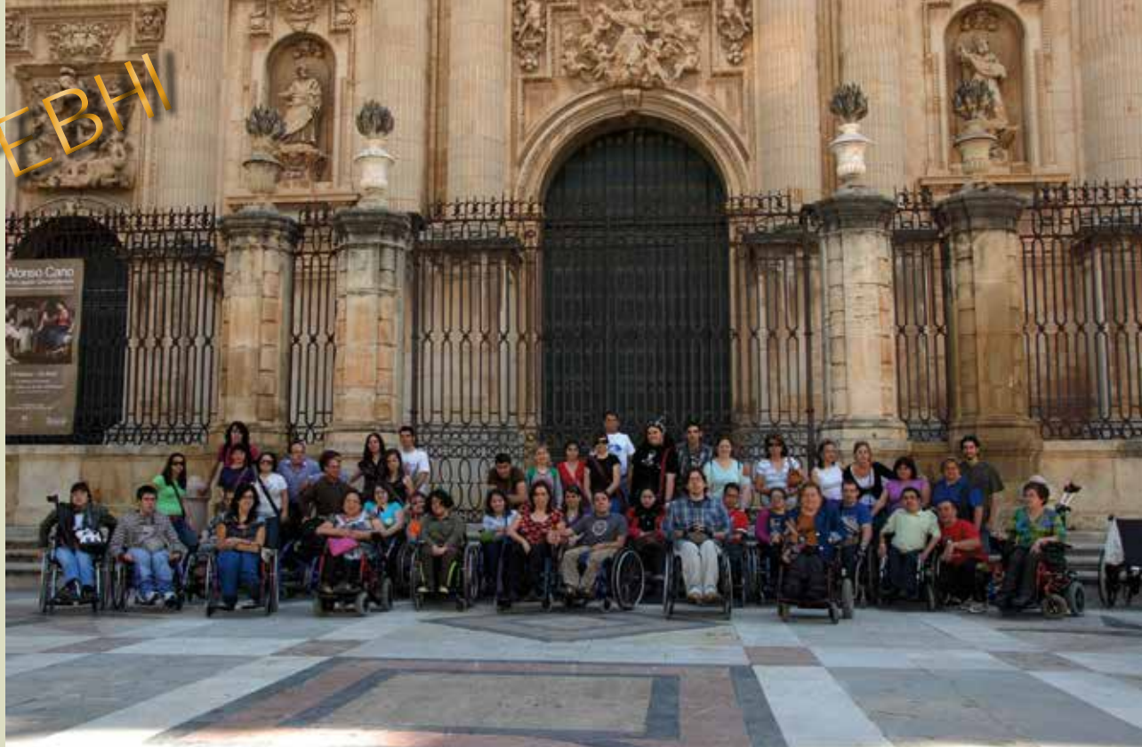
Los participantes disfrutaron de múltiples actividades