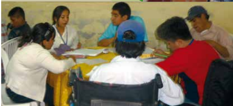
Participantes en el Proyecto desarrollado por CONFENADIP