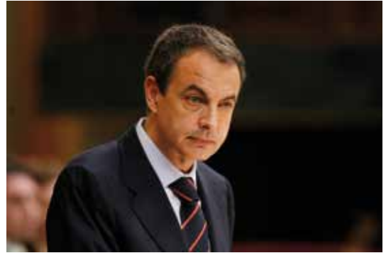
El presidente del Gobierno, José Luis Rodríguez Zapatero

Entre sus principales novedades, el texto reconoce algunos derechos y deberes importantes para los ciudadanos como recibir información sobre una intervención de salud pública antes de someterse a ella; conocer los posibles riesgos para su salud y también derecho a las prestaciones en salud pública, a la igualdad, a la confidencialidad y a la participación.