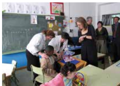
Aragón ha puesto en marcha medidas que favorecen la educación del alumnado con necesidades especiales

2% para empresas de más de 50 trabajadores. También se han regulado medidas para favorecer el empleo a colectivos en riesgo de exclusión y en cuanto al Empleo Público, en la actualidad se está redactando la nueva Ley de la Función Pública, que introducirá medidas para favorecer el ingreso de las personas con discapacidad en la Administración.