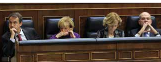
Zapatero en el Congreso de los Diputados

COCEMFE manifestó su total desacuerdo con los recortes anunciados por el Gobierno a la Ley de Autonomía Personal y Dependencia, a los gobiernos autonómicos y locales y a la Ayuda Oficial al Desarrollo.