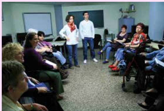
Usuaris durant els tallers impartits per COCEMFE CV