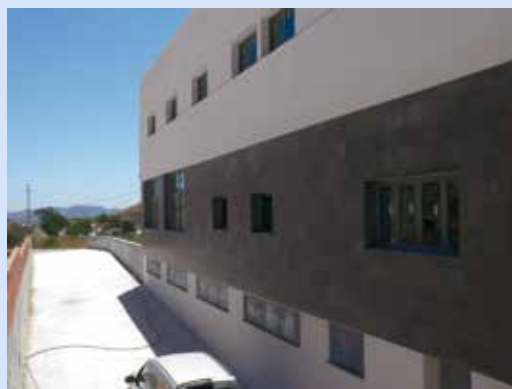
Diferentes vistas de la nueva Residencia