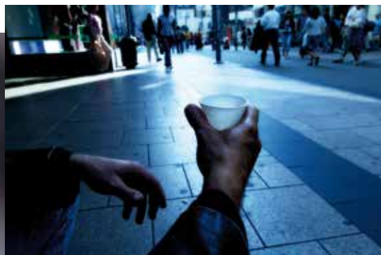
El programa se inició en junio

La federación pone algunas cifras a la relación entre elevado grado de discapacidad y el riesgo de exclusión. La probabilidad de estar bajo el umbral de la pobreza es tres veces mayor para las personas con discapacidad severa, según el informe “Discapacidad y exclusión social” del CERMI. Y la tasa de pobreza en los hogares con una discapacidad grave se incrementa entre un 60 y un 80%, ya que “estas personas asumen unos costes extraordinarios en su vida diaria y presentan nieves educativos, laborales y de atención sanitaria inferiores al resto”.