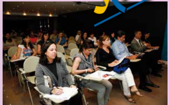
Los asistentes pudieron conocer de cerca el trabajo del SIL

El Colegio Oficial de Graduados Sociales de la Región de Murcia acogió las II Jornadas Técnicas de Empleo y Discapacidad sobre "Medidas de Fomento de Empleo de Personas con discapacidad" organizadas por esta institución y FAMDIF.