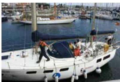
Las personas con discapacidad pueden participar en actividades náuticas abordo del Laion

El ocio es necesario para conseguir el bienestar, pero las condiciones en que se realiza, deben satisfacer las necesidades de todos, sin exclusiones y sin discriminaciones, garantizando el ejercicio de este derecho. Bajo esta pre-