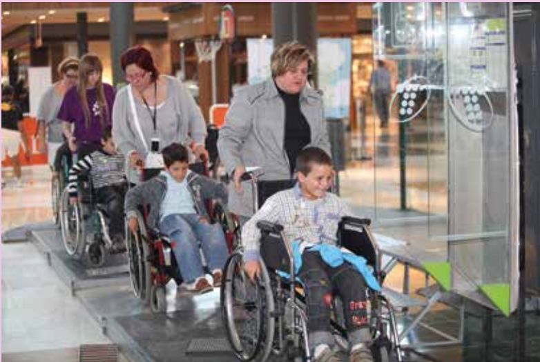
Varios niños participan en una de las actividades de sensibilización