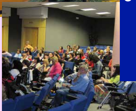
Distintos momentos de las jornadas