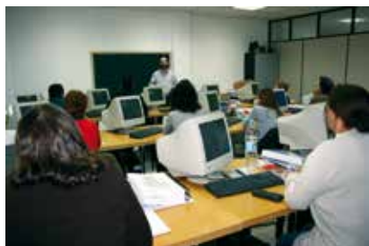
Según datos de Cogami en Galicia hay poca formación superior de personas con discapacidad

A pesar de la existencia de problemas en el transporte, la formación depende más del entorno familiar y social, que de la discapacidad.