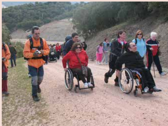
Participantes en una de las Jornadas de Senderismo

FEJIDIF con la colaboración de la empresa Hapthai Visitas Adaptadas S.L. organizan un viaje a Nueva York del 27 de agosto al 3 de septiembre por el precio de 1.900 euros en un hotel de 4 estrellas en Manhattan.