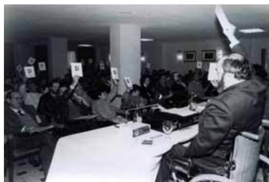
Votaciones en el Congreso de Granada

cación de sus estatutos para convertirse en Confederación, unir a todas las organizaciones de discapacidad física y dar una mayor coherencia a las reivindicaciones y actuaciones ante las diferentes administraciones, el colectivo y la sociedad en general. Desde entonces la entidad se llama COCEMFE.