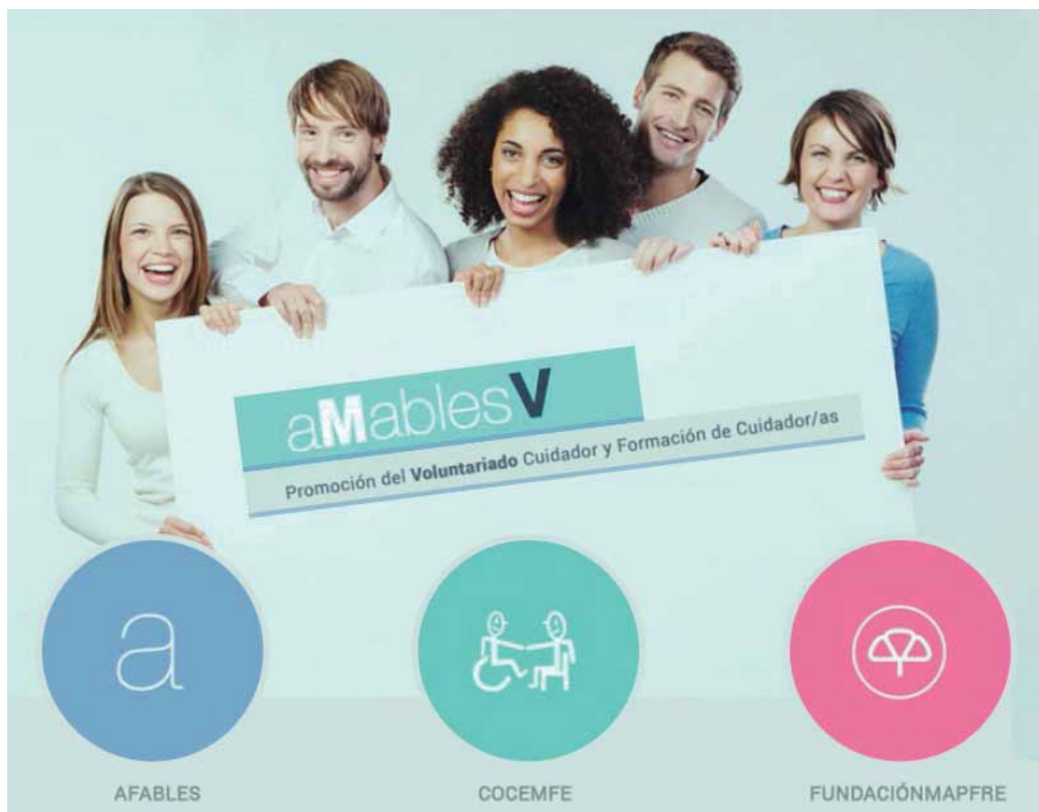
Cartel informativo de "AmablesV"

cipales mediante la formación y la creación de la Red de Voluntariado “AmablesV”. Esta iniciativa tiene su razón de ser en aquellos momentos en que los cuidadores principales tienen la necesidad, de forma puntual, de dejar a solas a las personas que cuidan, pues encuentran muchas dificultades para contar con alguien de confianza que supla este intervalo de tiempo, generalmente breve, y no previsto. Más de 300 voluntarios en más de 90 ciudades de toda España ya forman parte del proyecto “AmablesV”.