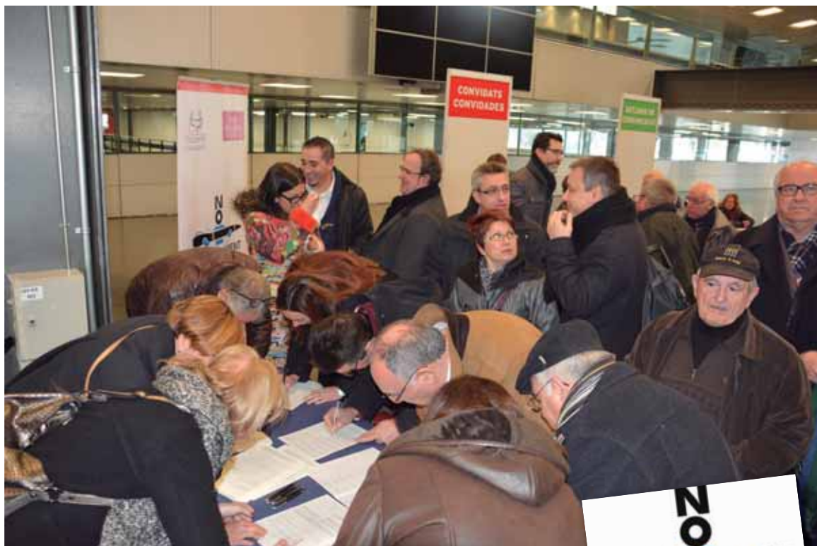
Logotipo de la campaña y recogida de firmas en Cataluña contra el copago confiscatorio en dependencia