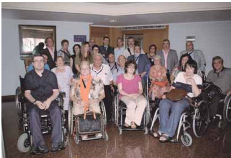
Consejo Estatal de COCEMFE elegido en 2012