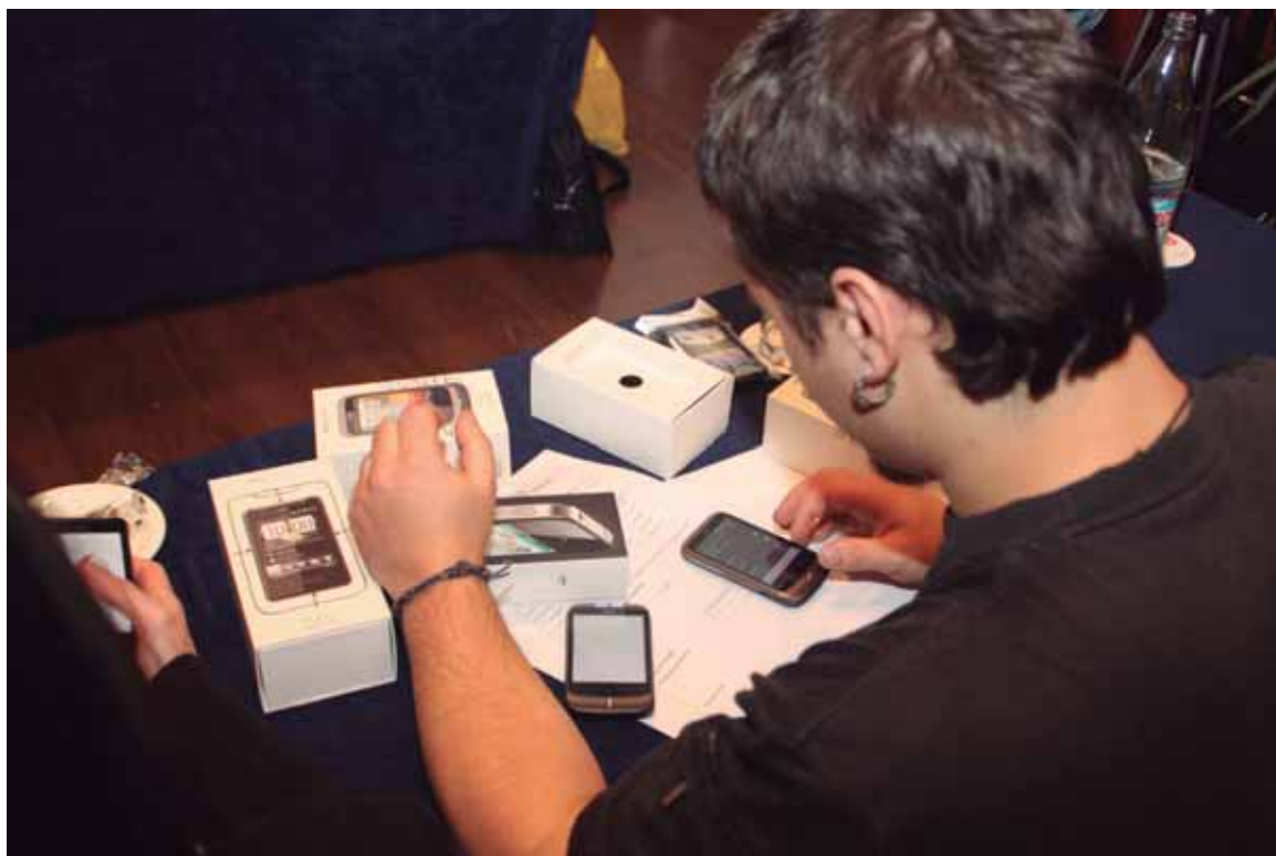
Desde COCEMFE se determina el grado de accesibilidad de terminales y accesorios

• 2009: COCEMFE empieza a colaborar con empresas de telefonía para valorar los equipamientos y proporcionar asesoramiento en la personalización de soluciones de comunicación. COCEMFE mantiene una estrecha colaboración desde 2009 con Vodafone y su Fundación para la valoración de equipamiento y personalización de soluciones de comunicación, conscientes de que representa un campo con múltiples posibilidades de generar nuevas soluciones de movilidad, comunicación y facilidad de uso de los productos y servicios, que posibilitan una mayor autonomía para todas las personas.