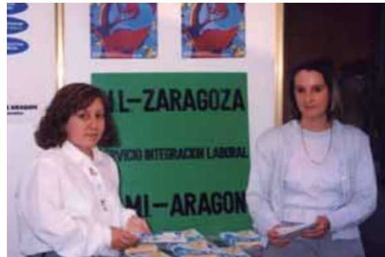
Personal del Servicio de Integración Laboral de Zaragoza

a más de 25.000 personas con discapacidad y sus familias.