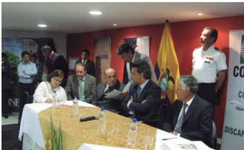
Firma de la creación de los Servicios de Integración Laboral de Ecuador

• 2006: Dentro de su trabajo en Cooperación para el Desarrollo, COCEMFE apoya todo el proceso de creación de los primeros Servicios de Integración Laboral en Ecuador , uno en Quito y otro en Guayaquil, proporcionando formación al equipo técnico en metodologías de intervención, aportando su experiencia y herramientas y facilitando la adaptación de las mismas a las necesidades del colectivo en este país. Desde entonces y hasta 2015, COCEMFE ha apoyado la creación de un total de 23 Servicios de Integración Laboral en Ecuador.