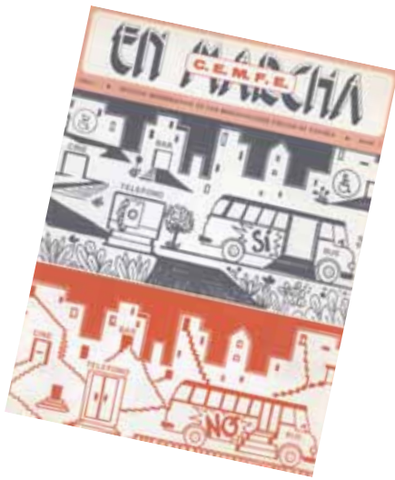
Portada del primer número de la revista "En Marcha"

• 1980: Sale a la calle el primer número de la revista "En Marcha" . Su objetivo, que se ha mantenido durante toda su vida, fue informar y denunciar, contando con el apoyo y colaboración de las asociaciones para ser el órgano de expresión de la entidad. Trasladar a las personas con discapacidad física y orgánica la actualidad relacionada con el colectivo, ser un punto de encuentro de las diferentes asociaciones donde las personas a las que representan puedan encontrar información útil, señalar los errores de las administraciones públicas en sus políticas de discapacidad y ofrecer soluciones a los mismos ha sido la principal labor de la revista en estos años.