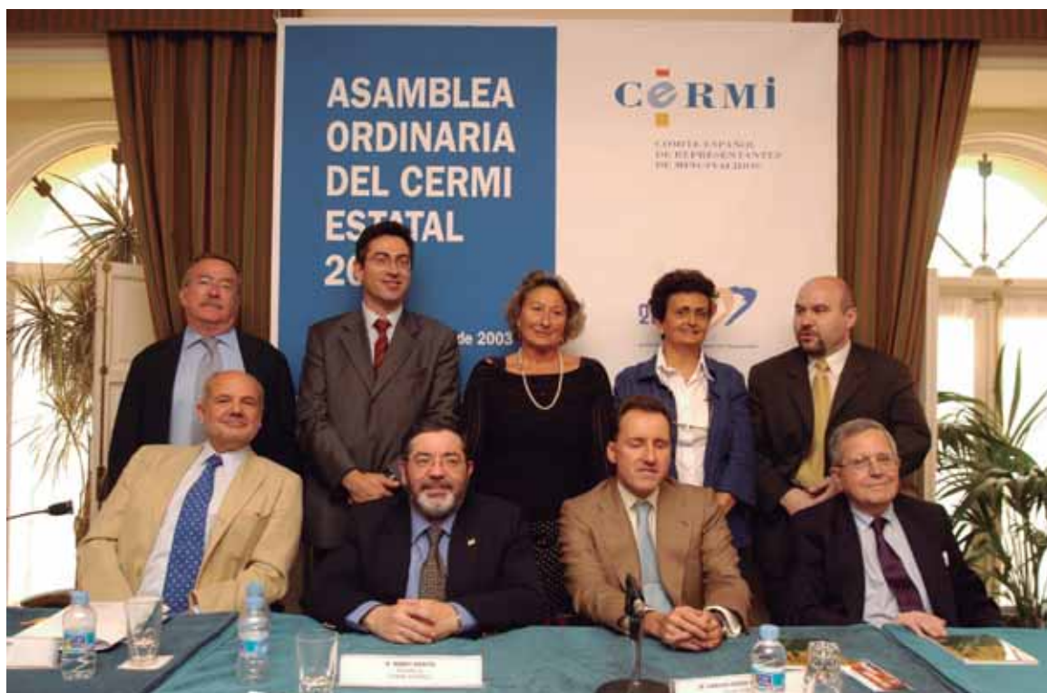
Foto de familia de la Asamblea Ordinaria del CERMI del año 2003