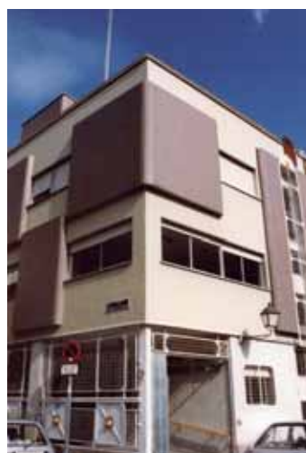
Fachada de la Residencia de COCEMFE

últimos veinte años del resto de las entidades del sector, para ofrecer una imagen más actual, acorde con los tiempos, a la vez que más dinámica, cercana y capaz de ofrecer visos de normalidad a la discapacidad física pero también orgánica. El logotipo fue diseñado por Javier Mariscal, quien cedió gratuitamente la utilización del mismo a la entidad.