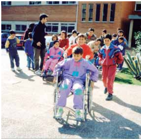
Educación integrada en un colegio ordinario

narios para continuar su formación, dejando los centros de educación especial. Tras numerosas modificaciones legislativas y constantes reivindicaciones desde COCEMFE y otras organizaciones en pro de una educación verdaderamente inclusiva, se ha avanzado considerablemente, ya que el 80% de los estudiantes del colectivo están actualmente en centros ordinarios.