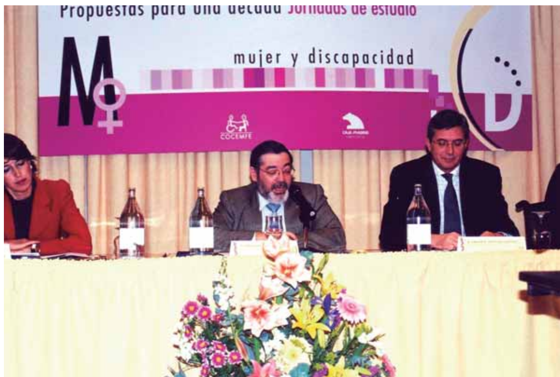
Acto de inauguración de las Jornadas "Oportunidades en Femenino. Mujer y Discapacidad, propuestas para una década"

dad de tener un espacio activo y participativo en la sociedad. El esfuerzo de las mujeres con discapacidad se difuminaba en la lucha común del colectivo y, con el paso de los años y un movimiento asociativo ya estable, la mujer con discapacidad comenzó a reivindicar y a tener su propio espacio dentro de las entidades. En COCEMFE enseguida se percibió esa necesidad de empoderar a la mujer con discapacidad, y en 2002 se organizaron unas jornadas de reflexión sobre la situación de la mujer con discapacidad en España bajo el título "Oportunidades en Femenino. Mujer y Discapacidad, propuestas para una década". Sus conclusiones,