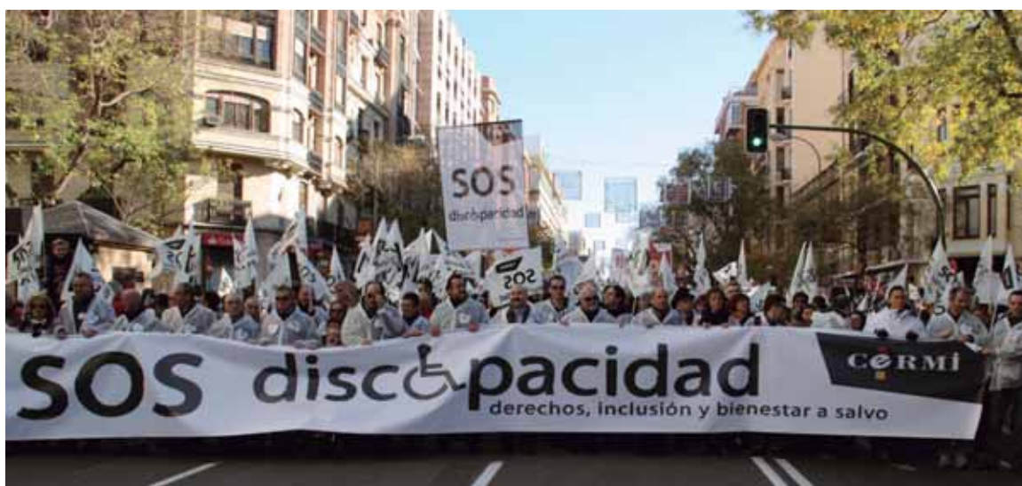
Cabecera de la marcha SOS Discapacidad

estar a Salvo” convocada el día 2 de diciembre en Madrid por el CERMI. 90.000 personas llegadas de toda España participaron en la misma. COCEMFE se involucró plenamente en esta iniciativa para poner de manifiesto que las personas con discapacidad física y orgánica estaban viviendo en primera persona unos recortes que suponían retrocesos de derechos y una merma del Estado del Bienestar y que las diferentes administraciones, independientemente del color político, se estaban equivocando y tenían que dar un giro de manera urgente. Este encuentro histórico y ejemplar, que reunió a personas con todo tipo de discapacidades, familiares, profesionales y simpatizantes, tuvo un éxito sin precedentes y supuso un llamamiento unánime y claro al respeto de los derechos de las personas con discapacidad y sus familias.