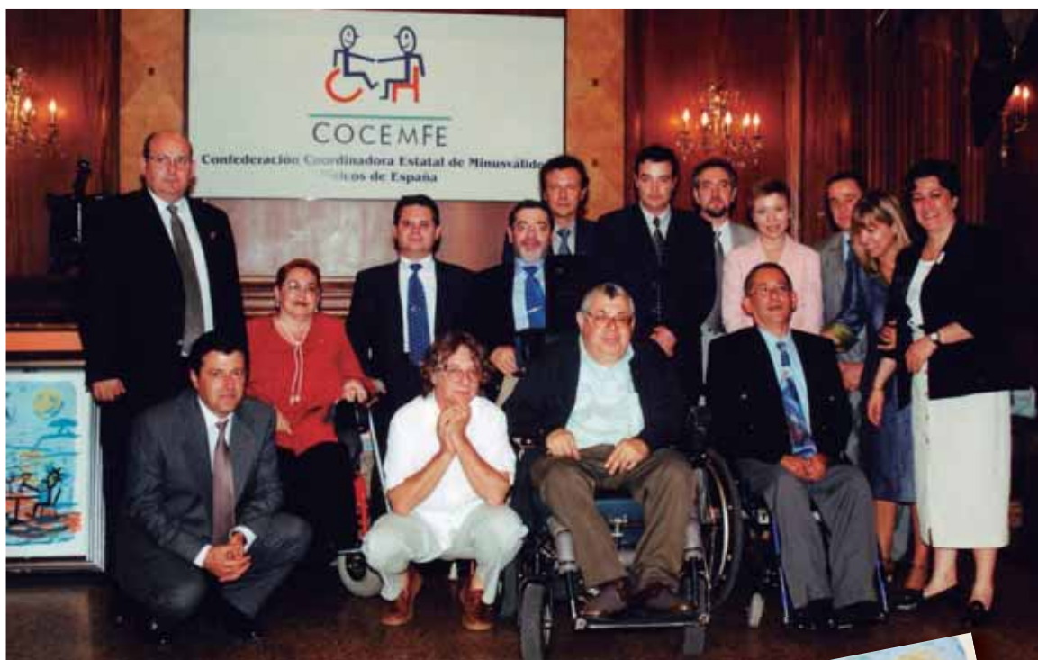
Foto de familia de la I Edición de los Premios COCEMFE (arriba); serigrafía