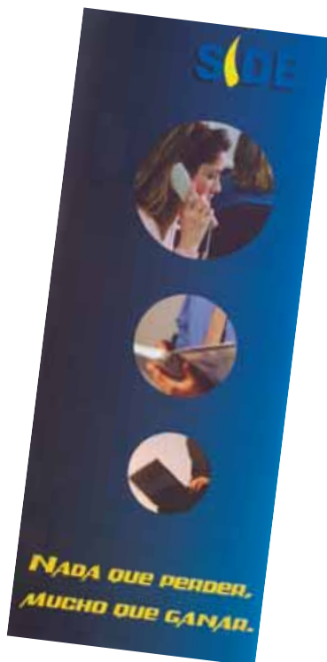
Tríptico informativo del SIDE

• 2001: Creación del Servicio de Información Directa a Empresas (SIDE) de COCEMFE. Es un servicio gratuito de atención telefónica a empresas y empleadores, especializado en la información y el asesoramiento en materia de contratación, selección de personal, intermediación laboral, autoempleo, adaptación de puestos de trabajo, cumplimiento de la cuota de reserva para personas con discapacidad, articulación de medidas alternativas de la cuota, etc. Ofrece un asesoramiento personalizado y ajustado a las necesidades concretas de cada uno de los usuarios de este servicio.