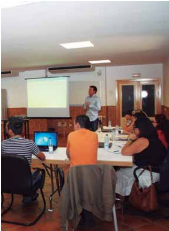
Curso de Comunicación para la Rescom en el 2011 celebrado en Toledo

• 2004: Creación de la Red de Responsables de Comunicación de las entidades miembros de COCEMFE (Rescom). Los cursos de comunicación de la Universidad Técnica de COCEMFE y la necesidad de impulsar la difusión de la actividad de las entidades miembros fueron el caldo de cultivo para crear esta red. Además de facilitar las relaciones entre los responsables de comunicación de las organizaciones de COCEMFE, la Rescom ha conseguido facilitar las labores de comunicación de las entidades, mantener un fluido intercambio de información y coordinar importantes acciones conjuntas.