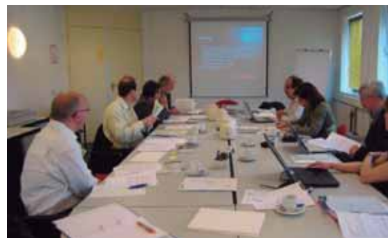
Reunión de USEM en Madrid

en los procesos de normalización y estandarización de elementos relacionados con las nuevas tecnologías de la información y la comunicación; y NODES para el desarrollo de un sistema de enseñanza para personas en riesgo de exclusión que mejore su competitividad, el acceso al empleo y la movilidad laboral.