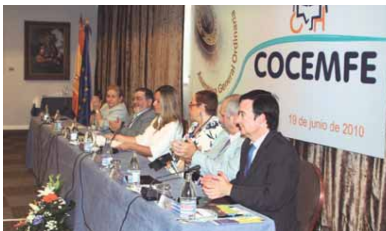
La ministra de Sanidad y Política Social, Trinidad Jiménez, clausuró la Asamblea General de COCEMFE en 2010