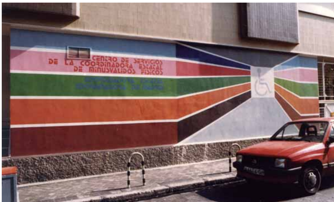
Fachada del entonces denominado "Centro de Servicios" de la entidad

• 1987: COCEMFE organiza el primer Programa de Vacaciones junto al IMSERSO , con dos turnos en los que participaron 70 personas, y cuyo objetivo es permitir al colectivo disfrutar en igualdad de condiciones de su tiempo de ocio, promoviendo al mismo tiempo su bienestar emocional, su integración y normalización social y las relaciones interpersonales entre los participantes. Desde entonces hasta ahora 33.300 personas con discapacidad han viajado con nosotros. Desde la creación de la Fundación COCEMFE, en 1999, es gestionado por esta institución.