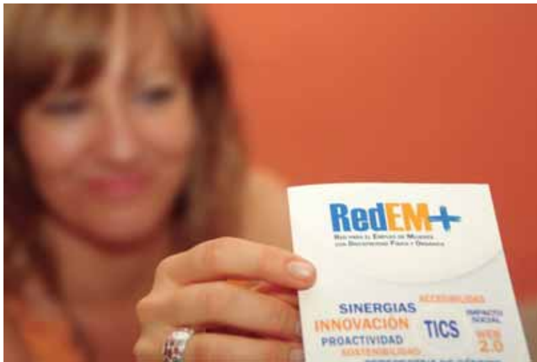
Usuaria de RedEM+ recoge un folleto informativo

• 2015: COCEMFE desarrolla el proyecto RedEM+ de la mano de la Asociación Nacional de Agencias de Colocación (ANAC) y de la Fundación Universia. El objetivo fundamental de esta iniciativa es mejorar el posicionamiento de las mujeres con discapacidad física y orgánica en el mercado de trabajo a través de la definición y refuerzo de sus competencias profesionales y de la creación de un canal innovador y sostenible de inserción laboral 2.0 que facilita la conexión entre las mujeres de este colectivo y las empresas empleadoras: www.redemdisc.es .