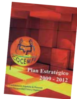
Portada del I Plan Estratégico de COCEMFE

la Confederación, los órganos de gobierno, las entidades miembros y las propias personas con discapacidad beneficiarias finales del trabajo de representación y prestación de servicios de COCEMFE. El importante ejercicio de reflexión, evaluación y generación de propuestas que supuso sirvió para identificar nueve líneas estratégicas y sus correspondientes objetivos a alcanzar para acercar a la Confederación a su misión y visión para este periodo. Tanto este primer plan como el segundo (2013-2016) han permitido a la entidad seguir realizando su actividad de la manera más eficaz posible, dejando claro quiénes somos, qué buscamos y cómo conseguirlo.