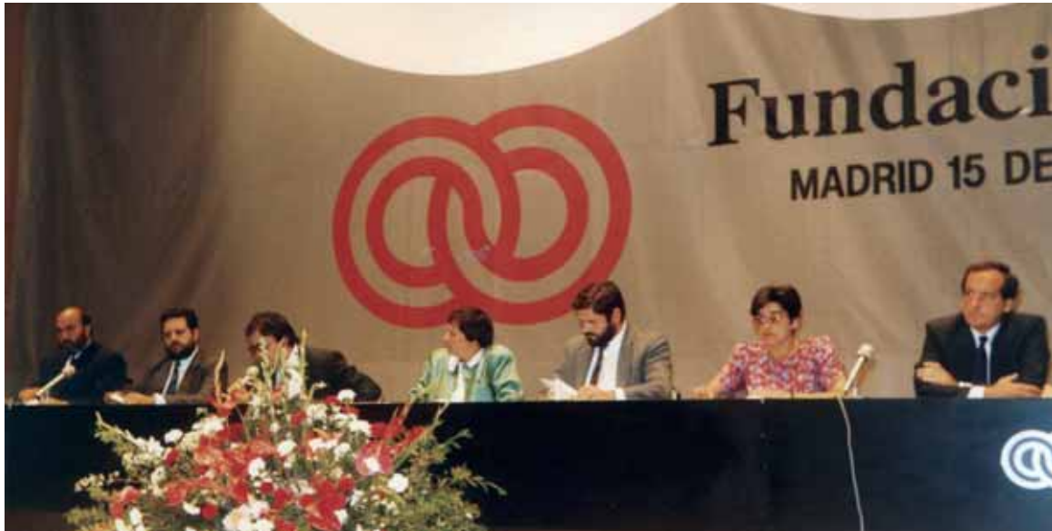
Acto de presentación de la Fundación ONCE

• 1988: Nace la Fundación ONCE para la cooperación e integración social de las personas con discapacidad, con la ONCE como miembro fundador y la representación de las principales entidades del país: COCEMFE, FEAPS, CNSE y FIAPAS. Su objetivo, que se ha mantenido desde entonces, era “coadyuvar a la consecución de la autonomía personal y plena integración” de las personas con discapacidad “sin sustituir las obligaciones públicas del Estado” con este sector de la población.