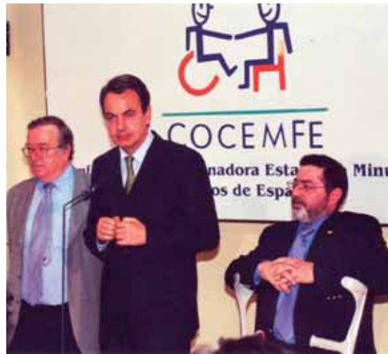
Intervención de José Luis Rodríguez Zapatero tras la visita a la residencia de COCEMFE