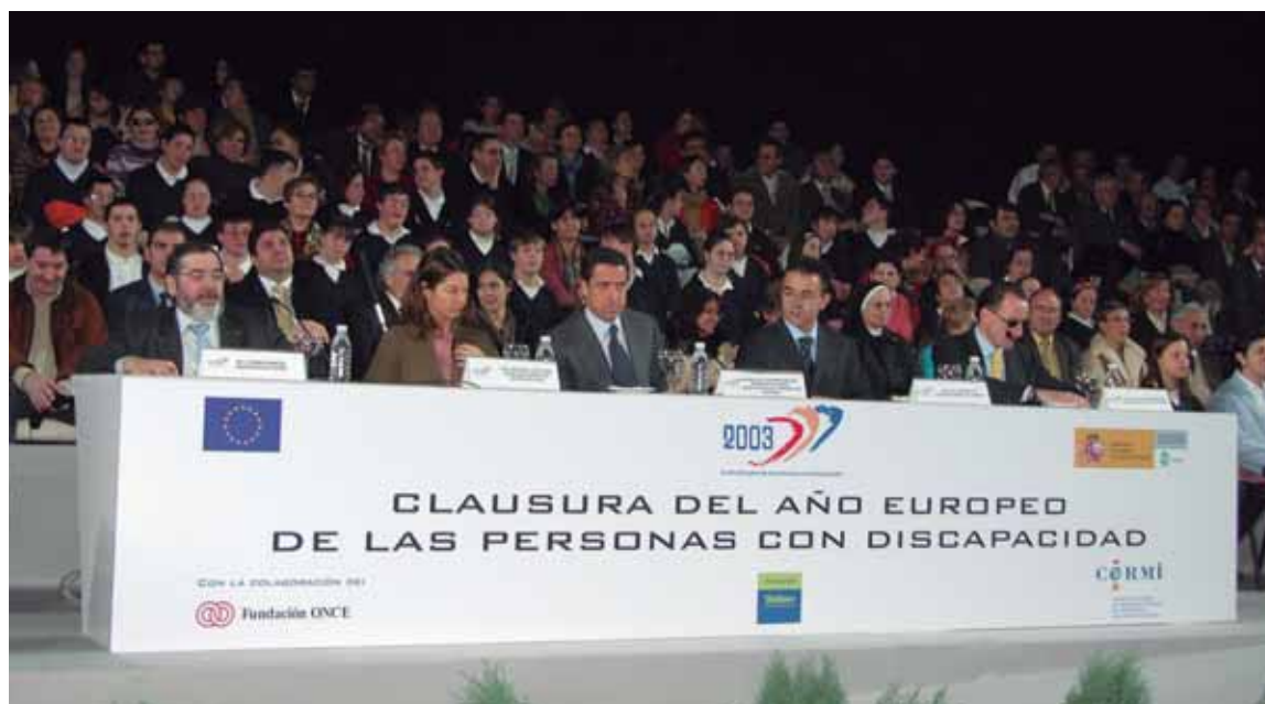
Inauguración (izquierda) y clausura (derecha) del Año Europeo de las Personas con Discapacidad, con un importante apoyo institucional

• 2003: Un año de Ley. La aprobación de la Ley de Igualdad de Oportunidades, No discriminación y Accesibilidad Universal (LIONDAU) supuso para la discapacidad un hito relevante, al pasar de contemplarse las necesidades del colectivo desde un punto de vista asistencialista a situarse en el de los derechos humanos. Así, queda explícito que los poderes públicos deben asegurar a través de unas garantías suplementarias todos sus derechos: civiles, sociales, económicos y culturales. Con la Ley de Protección Patrimonial de las Personas con Discapacidad , los familiares del colectivo pueden contar ya con una tranquilidad y seguridad jurídica cuando ya no estén o no puedan prestarle su apoyo.