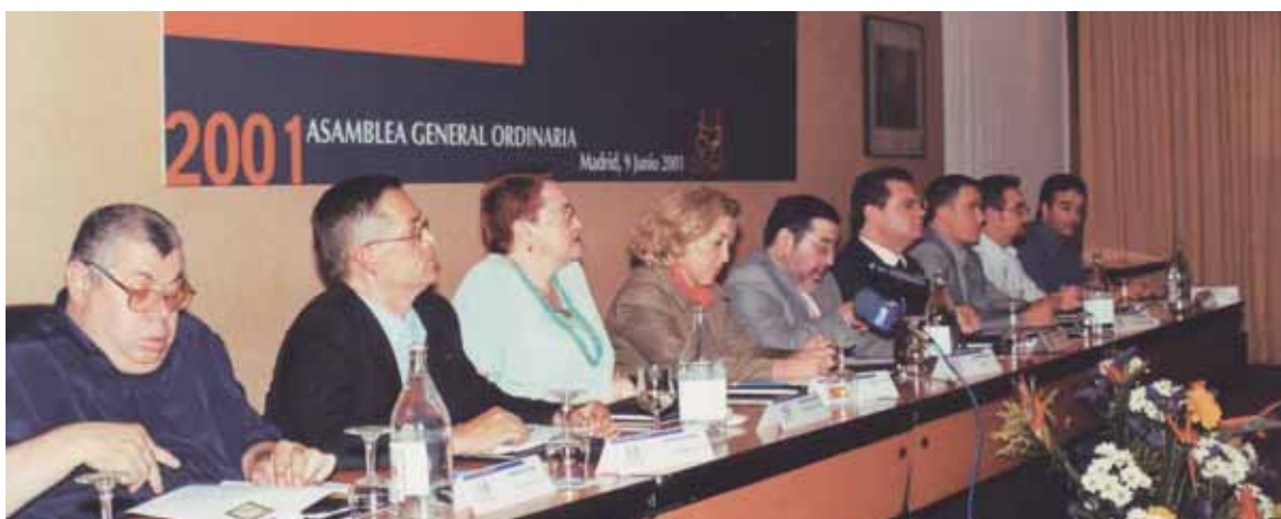
El acto de inauguración de la Asamblea de 2001 contó con la participación de la Secretaria General de Asuntos Sociales, Concepción Dancausa