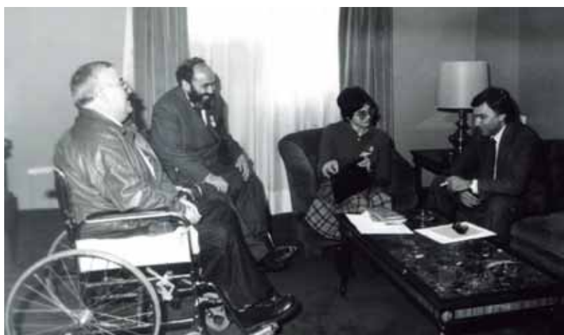
Reunión de una delegación de COCEMFE con el presidente del Gobierno, Felipe González

• 1983: Felipe González, presidente del Gobierno, recibe a los representantes de la entidad. Una de las resoluciones del I Congreso que celebró COCEMFE fue solicitar una entrevista con quien fuera elegido nuevo presidente del gobierno para plantearle la creación de una comisión interministerial para vigilar el cumplimiento de la LISMI y la financiación suficiente en los presupuestos generales para su desarrollo. Así que nada más conseguir el triunfo los socialistas comenzaron los trámites para que se celebrase ese encuentro. Felipe González recibió, durante media hora, a tres representantes de la organización, en el Palacio de la Moncloa. Durante la reunión se le transmitió la preocupación que tenía el movimiento porque no se pudiera desarrollar la LISMI por falta de medios económicos. González estuvo receptivo a todas las propuestas y consideraciones que se le comen-