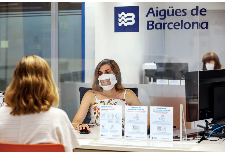
El uso de mascarillas transparentes ya está implementado en varios centros de trabajo y oficinas de atención al cliente del grupo.